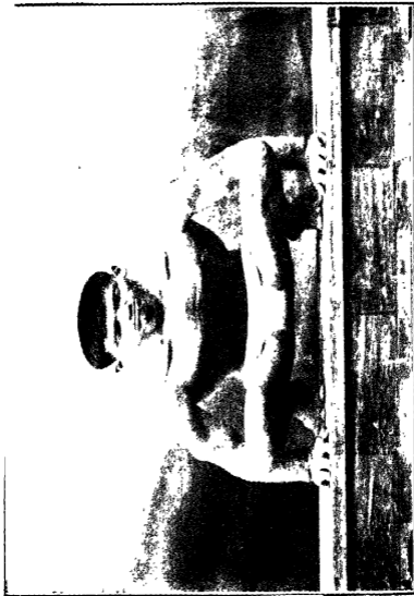
उड्डियान ( पाळथी मारकर )